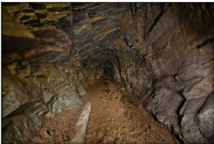
Figura 1: Túnel minero galería San Antonio.

En el reconocimiento de campo se encuentran los siguientes aspectos: cuatro galerías: Holman, Richard, Santa Bárbara y San Antonio. La única con acceso y que pudo ser recorrida fue San Antonio, que cuenta con un túnel principal de unos 76 m (figura 1).