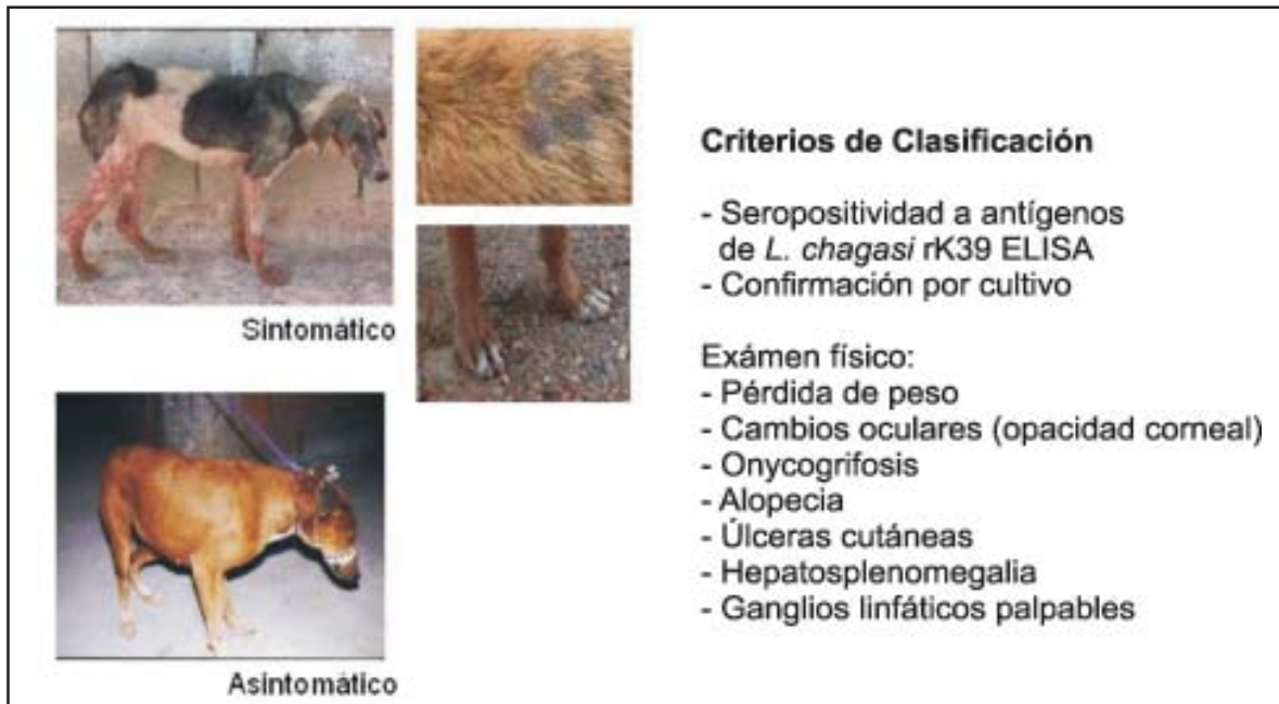
Fig. 1. Leishmaniasis visceral canina: Principales criterios de clasificación para definir a los perros seropositivos como sintomáticos o asintomáticos, según la presencia y severidad de los signos descritos.

inmunidad mediada por células, ésta es capaz de controlar la infección y el animal permanece asintomático. Por el contrario, la ausencia de esta respuesta conlleva a la progresión de la enfermedad, causando signos y síntomas evidentes en los perros (Pinelli et al. , 1994; Moreno & Alvar, 2002). En estos casos los parásitos se diseminan en la médula ósea, hígado y bazo causando una enfermedad crónica, en la cual una respuesta inmune descontrolada del hospedador contribuye con la patología en estos órganos, haciéndola potencialmente fatal.