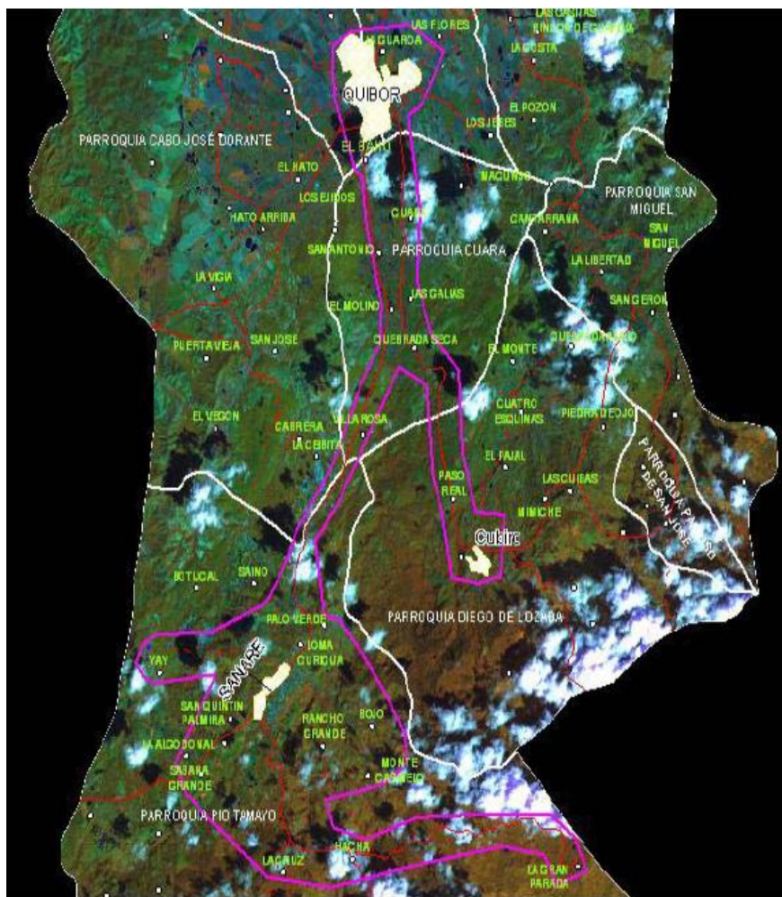
Gráfico 4. Delimitación del Eje Sanare-Quíbor-Cubiro