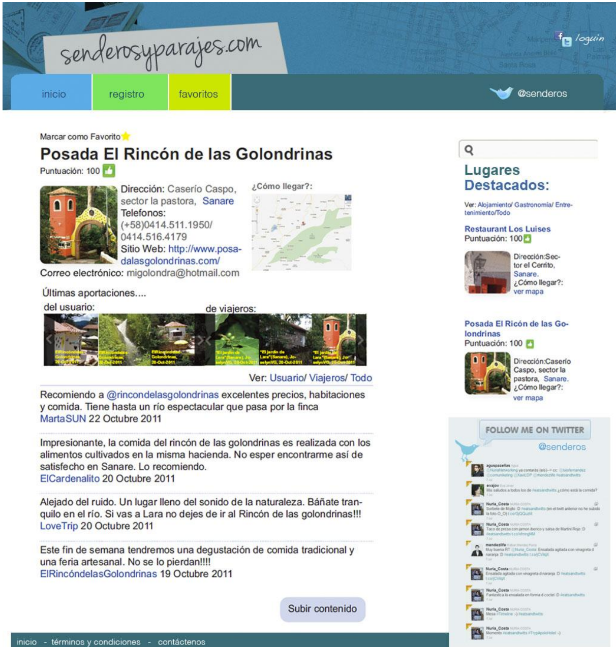
Gráfico 9. Pagina de Servicio (Posada el Rincón de las Golondrinas)