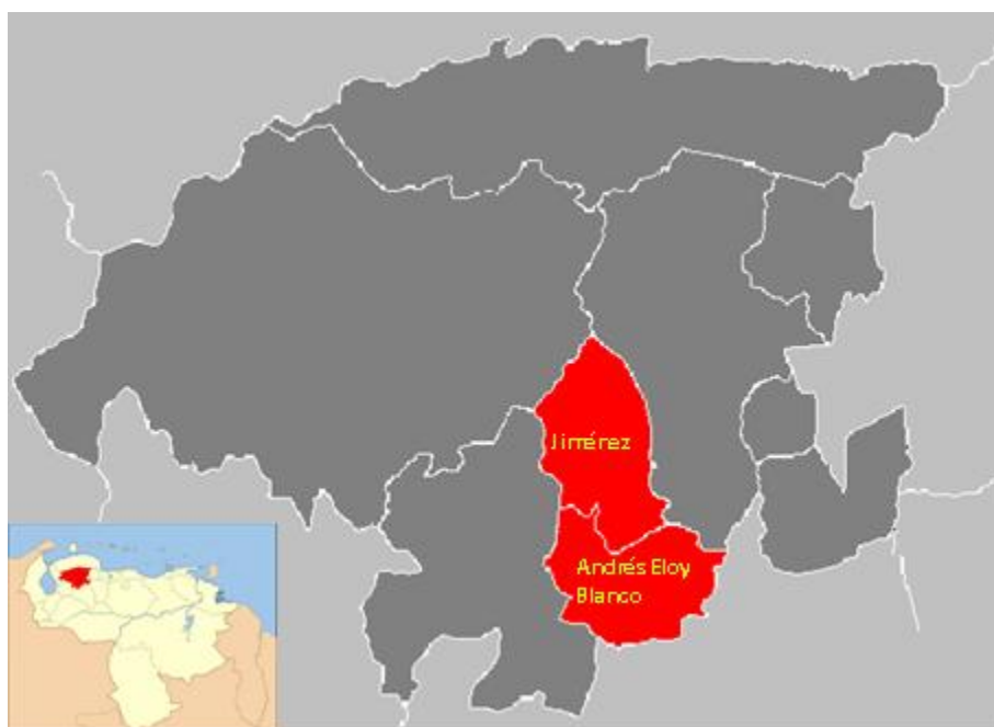
Gráfico 3. Ubicación geográfica del Estado Lara. Municipios Jiménez y Andrés Eloy Blanco

A continuación se presentan algunas características de estas localidades que se consideran importantes a tener en cuenta y que se relacionan directamente con la consecución de los objetivos de esta investigación.