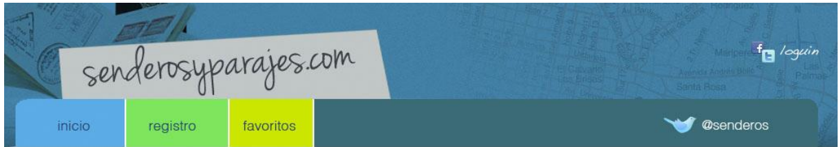
Gráfico 7. Mi Perfil