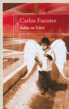
ADÁN EN EDÉN CARLOS FUENTES / Alfaguara