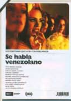
SE HABLA VENEZOLANO MARCAPASOS (VARIOS AUTORES) Editorial Punto Cero