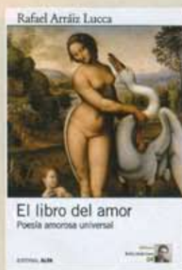
EL LIBRO DEL AMOR - POESÍA AMOROSA UNIVERSAL RAFAEL ARRÁIZ LUCCA / Editorial Alfa

Este es un libro para cualquiera. Sí: no está escrito para expertos sino para personas de a pie que, como usted o como yo, que se endeuda por necesidad o gusto y luego no encuentra cómo salir de esas deudas. Realizado a partir de la experiencia personal del autor —es su primer libro— le enseñará cuándo y por qué asumir una deuda, cuáles son los mejores tipos de créditos, cuándo usar las tarjetas de crédito y cómo salir de los atolladeros y angustias que se generan a fin de mes. Es una herramienta útil para organizar sus gastos y adquirir los bienes y servicios que le permite un crédito inteligente.