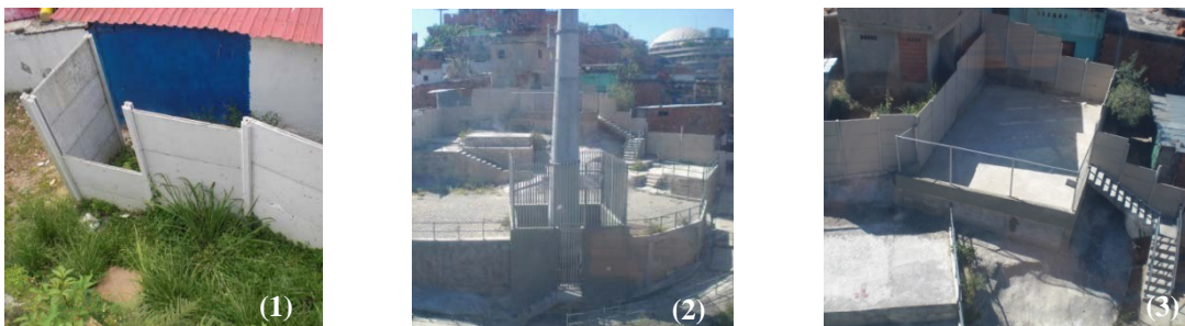
Figura 1. (1) Muro límite para protección de las viviendas, colocado durante el proceso constructivo de las estaciones de Metrocable. (2) y (3) Áreas de usos comunes construidas complementariamente dentro del proyecto del Metrocable.

Al registrar diversos puntos de vista entre los entrevistados y paralelamente realizar visitas al sistema observamos la ausencia de la comunidad en el resultado del proyecto, ya que no percibimos la apropiación de los espacios en su totalidad y por consiguiente muchas de estas áreas se encuentran en estado de abandono por más alto que sea su potencial para el desarrollo urbano y social de la zona (Figura 1). La apreciación por parte de un profesional estatal implícito en este plan nos introduce a la comparación con otros desarrollos a nivel Latinoamericano donde se han producido experiencias con sistemas similares, en este caso en Medellín y Brasil (Figura 2) se percibe que la participación comunitaria por el contrario tiene el protagonismo de la obra