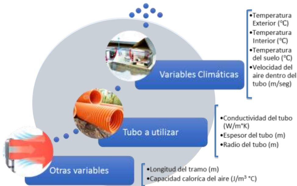
Figura 2: Datos de Entrada: valores requeridos por la aplicación para el cálculo y dimensionado de tubos enterrados.