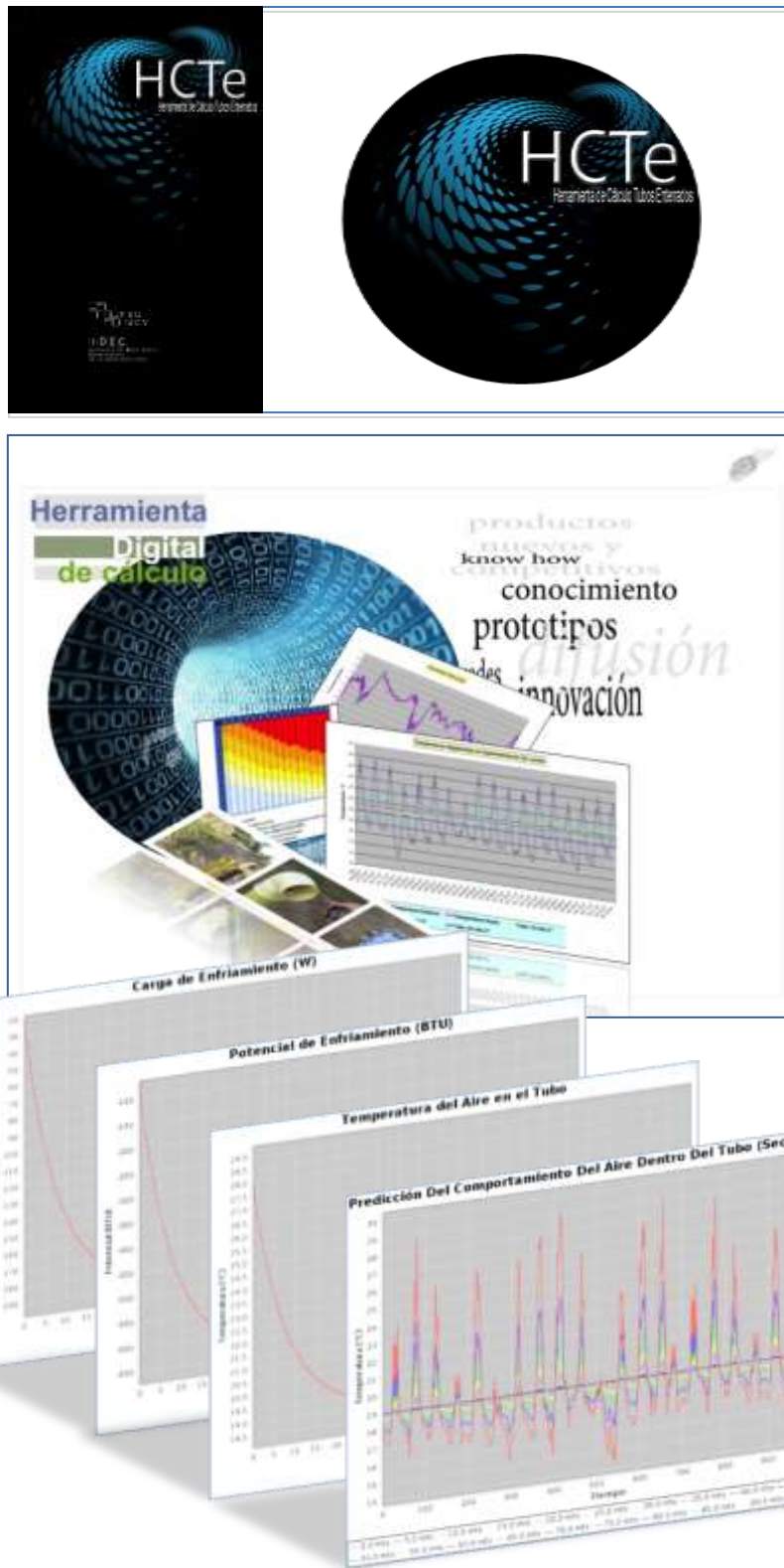
Figura 4: Imagen Gráfica de la aplicación y gráficas que se obtienen