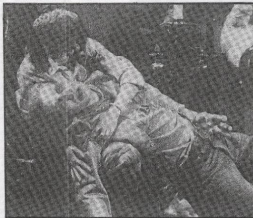
¿Tendrán sueños en el ataúd? El regreso de los muertos vivientes.

Muchas de las primeras películas de horror fueron, a la par, éxitos económicos y verdaderas obras de arte, gracias a realizadores como Robert Wiene ( El gabinete del Dr. Caligari , 1920), Friedrich W. Murnau ( Nosferatu , 1921), Jean Epstein ( La caída de la casa Usher , 1928), Carl Dreyer ( Vampyr , 1930) o Tod Browning ( Freaks , 1932). Pero la perspectiva de ganancia fácil atrajo pronto a una pandilla de mediocres, quienes para asegurarse la parte más gruesa de la taquilla recurrieron a explotar brutalmente el instinto sadomasoquista, a crear una artificial ilusión de variedad mediante la escisión del género en sub-géneros (vampiros, monstruos fabricados con partes de cadáveres, hombres-lobo, momias vengativas que resucitan), y a emplear expedientes como el de los "regresos" de Drácula, del hombre-lobo, de sus novias, esposas, hijos y nietos. Tal decadencia toca fondo en ciertas piezas de basura que ponen la comicidad imbécil al servicio del horror, o viceversa, tipo "Abbott y Costello, los Tres Chiflados y Francisquito el mulo parlanchín versus Frankenstein y el hijo del monstruo de la laguna negra". Esto anuncia ya el las-