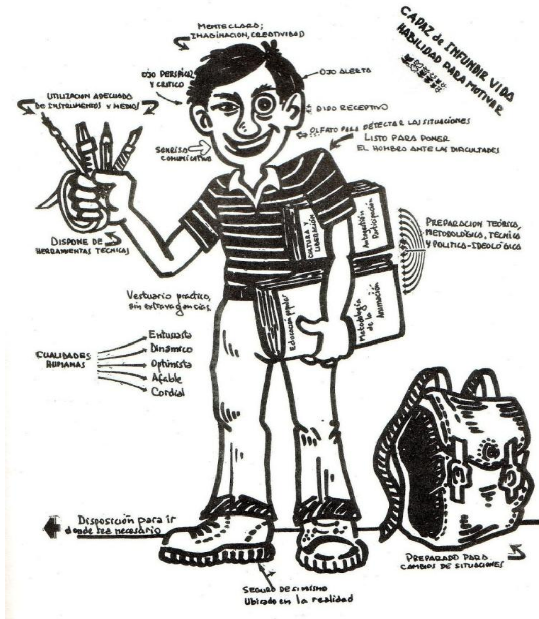
Figura N° 2. Perfil del Animador Sociocultural