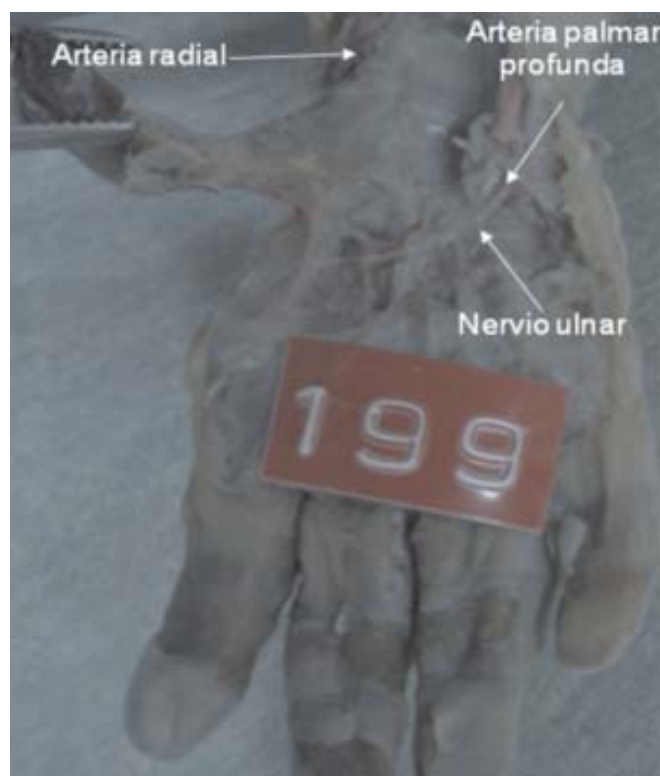
Figura 5.2: Ramo terminal ulnar profundo delante de la arteria palmar profunda.