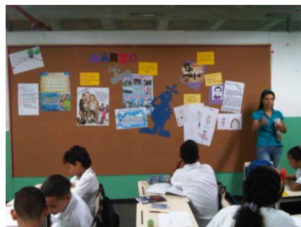
Tabla No. 2. Actividades grupales.

5- Dinámicas de grupo con cada uno de los grados para conocer de manera general la tendencia del grupo, sus necesidades y fortalezas y dinámicas de grupo en 6to. grado para conocer aspectos del desarrollo psico-afectivo y propiciar el análisis participativo para la búsqueda de soluciones, control de emociones y formulación de un proyecto de vida en bachillerato.