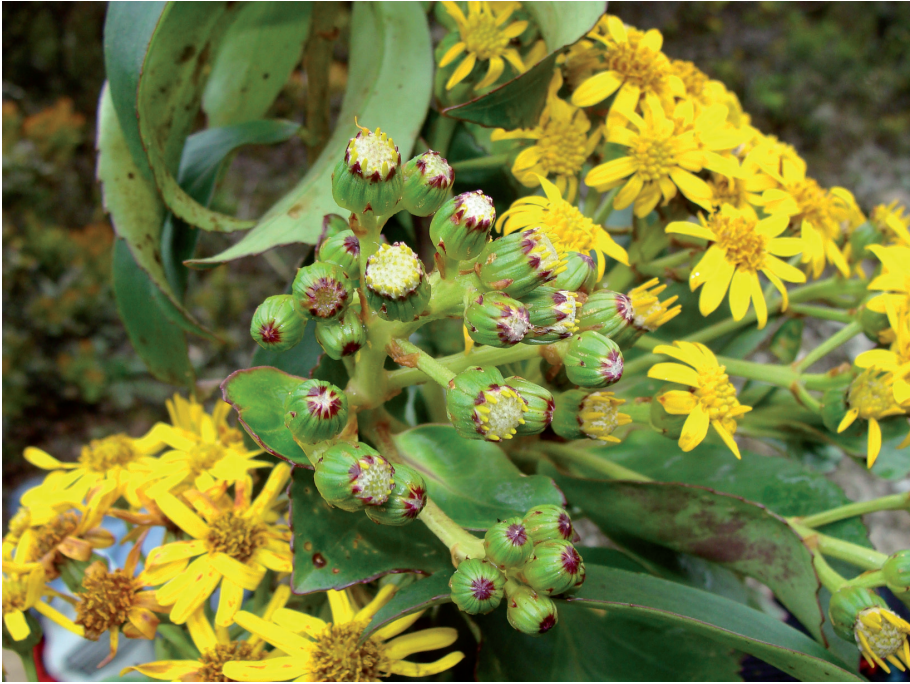
Fig. 2. Pentacalia gritensis M. Lapp, T. Ruiz-Z. et P. Torrecilla