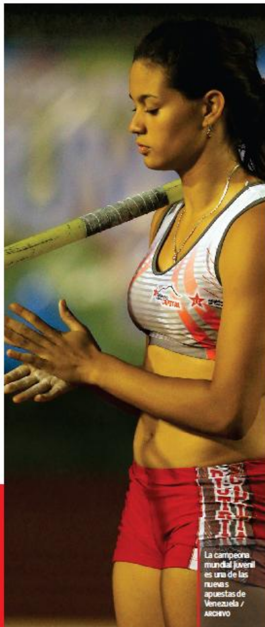
La campeona mundial juvenil es una de las nuevas apuestas de Venezuela

Para el campeón olímpico, Rubén Limardo, pocas federaciones están trabajando en el relevo. "Logramos tener la mayor participación en los Olímpicos de la Juventud de Nanjing, pero nos falta más. Por ejemplo, nuestra federación –esgrima– no llevó ningún atleta porque tuvimos un tiempo sin directiva ni organización", reveló el espadista.