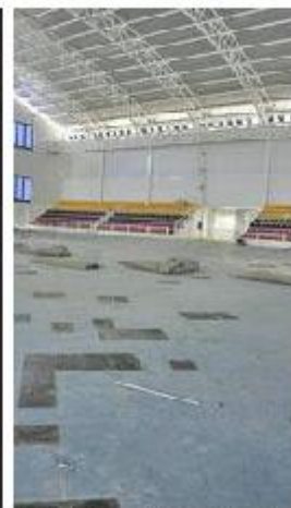
La Ciudad Olímpica de San Juan de los Morros sirvió de refugio