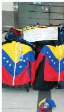
La selección criolla de Waterpolo se quedó varada en Argentina