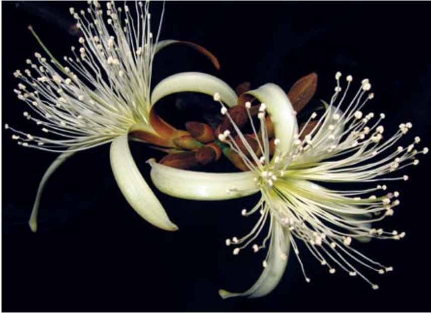
Fig. 1. Flores en anthesis de Pachira quinata .

metro externo), la cual pasa por el eje de la flor; en P. quinata corresponde con el androceo. 3. Diámetro del tubo de la flor: en el caso de P. quinata el tubo está formado por una estrecha cavidad en la base de la flor. 4. Largo de la flor: distancia desde la base hasta el extremo más alto de la flor; en el caso de P. quinata el largo es la distancia desde la base de la flor, justo al lado de la inserción del ovario hasta el estigma. 5. Largo del tubo de la flor: en P. quinata es la distancia desde la base de la flor hasta la separación de los pétalos. 6. Hercogamia: mínima distancia de separación entre el estigma y las anteras.