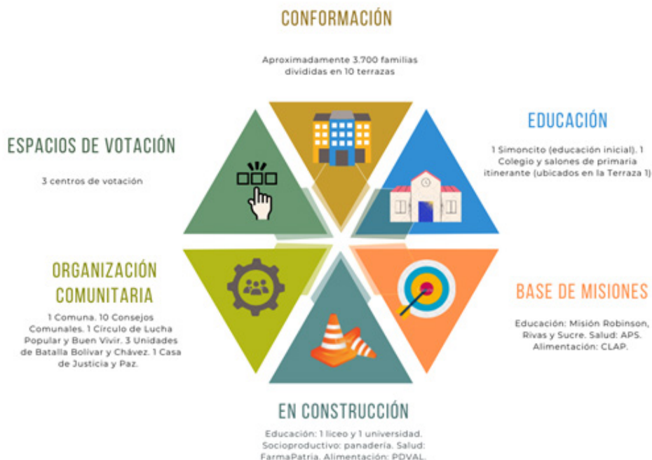
Imagen n° 1. Caracterización de la Ciudad Socialista Belén