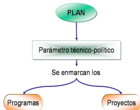
Figura N° 2. Parámetro técnico-político de los programas y proyectos

fundamental es que el programa suele permanecer en el tiempo, mientras que el proyecto siempre tendrá un inicio y un fin.