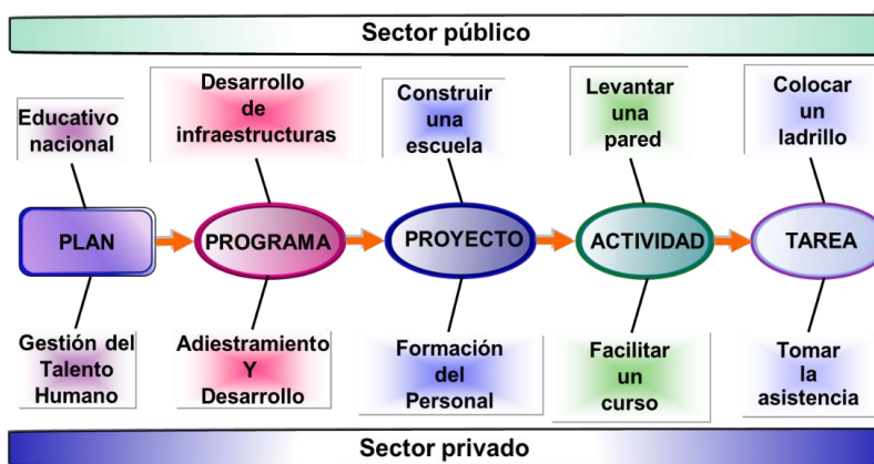
Figura N° 4. Casos prácticos de los niveles operacionales para la planificación estratégica para el desarrollo social.

necesidades a través de un programa de adiestramiento y desarrollo? ¿Cuántos programas relacionados con el personal se deben desarrollar para cumplir con el plan de gestión de talento humano de una empresa? Ambos casos, se pueden observar de manera práctica a través de la figura N°4.